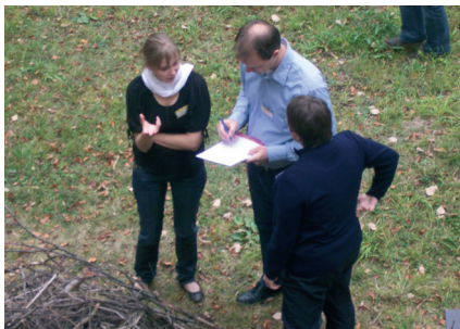
Lösungssuche in Arbeitsgruppen an der Akademie für Natur- und Umweltschutz Baden-Württemberg

Ein zentraler Aspekt der Mediation ist die Erarbeitung der Interessen der TeilnehmerInnen. Wenn auch in der Wirtschafts- und Umweltmediation die persönlichen Interessen der Beteiligten manchmal eine weniger zentrale Rolle spielen als bei der Familienmediation, ist es notwendig, diesen Umweg zu machen: Nur so kann die Gruppe das Spektrum an möglichen Lösungen ausweiten und bleibt nicht in dem Konflikt gefangen. Wie die MediatorInnen die Gruppe auf diesem Umweg begleiten, entscheidet über den Erfolg. Wenn der Verdacht aufkommt, es handele sich um »Gefühlsduselei« oder »Psychologisieren«, ist das Vertrauensverhältnis schnell gestört. Hier gilt es, für jede Gruppe kreative Möglichkeiten für diesen Umweg zu finden, für manche Gruppen passt z. B. eine »outdoor«-Aktivität, wie eine Ortsbegehung.